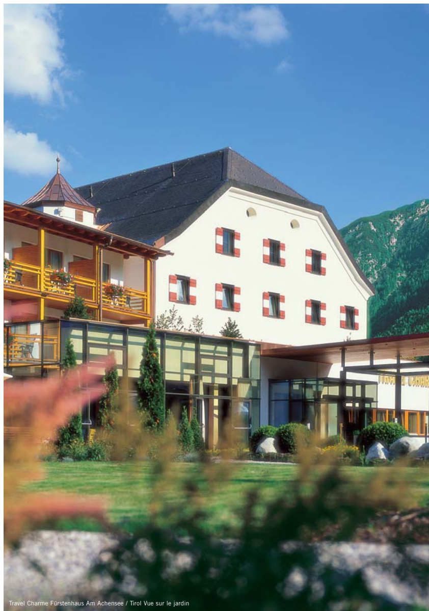
Travel Charme Fürstenhaus Am Achensee / Tirol Vue sur le jardin