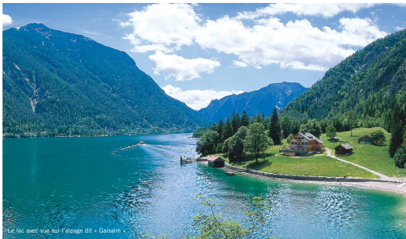
Le lac avec vue sur l'alpage dit « Gaisalm »