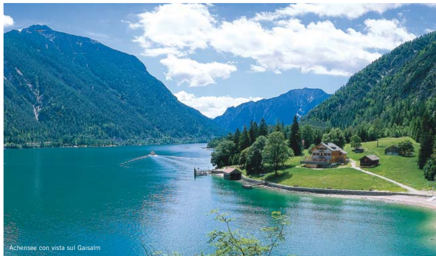
Achensee con vista sul Gaisalm