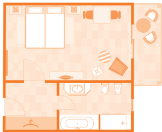
Camera doppia standard (esempio disposizione)

Da ca. 51 a 64 m 2 ; spazioso ed elegante soggiorno con zona salotto dotata di divano e poltrone, un tavolo e 2 sedie; camera da letto separata; bagno con vasca, doccia, WC, bidet e asciugacapelli; tutte le suite si trovano al piano terra e dispongono di una terrazza