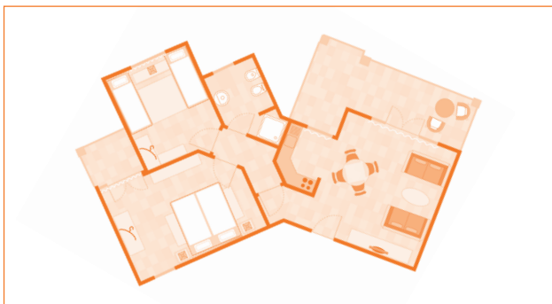
Resort apartment 1 (esempio)

Ca. 51 m 2 ; con balcone o terrazza, impianto di climatizzazione, TV