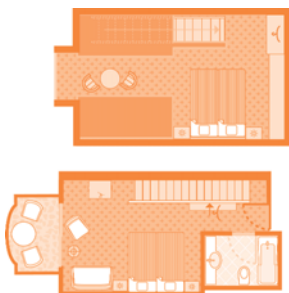
Maisonette mit Balkon (Wohnbeispiel)