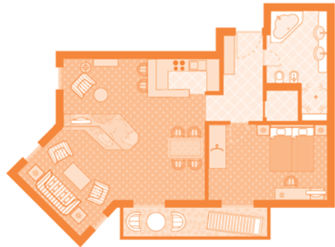
Residenz 2 (Wohnbeispiel)

Ausstattung: 2 Schlafzimmer; ein Ankleideraum; Küche; 2 Bäder (davon eines mit Dampfdusche und großer Wanne), großzügiger Wohnbereich mit Sitzgruppe, Esstisch für 6 Personen; Gäste-WC; romantisches Maisonette-Turmzimmer mit gemütlichem Sofa und Sessel; Aufbettung möglich (Couch und ein Zustellbett)