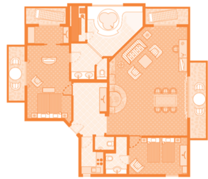
Residenz 3 (Wohnbeispiel)