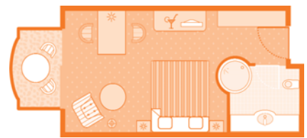
Doppelzimmer mit Balkon (Wohnbeispiel)

4.) die elegante Kurhaus-Suite, ca. 107 m 2 ; direkter und seitlicher Seeblick; separater Wohn- und Schlafbereich; großzügiger Eingangsbereich; Gäste-WC, großzügiges Badezimmer mit Whirlwanne, Erlebnisdusche und Sauna sowie einem separaten WC mit Bidet; die Fenster sind aus speziellem Sicherheitsglas