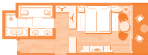
Doppelzimmer Standard (Wohnbeispiel)

3.) 2-Raum-Ifensuite: ca. 68 m 2 ; im Obergeschoss des Rundbaus mit großem umlaufendem Balkon und Panoramablick auf die Berge; großzügiger eleganter Wohnbereich mit Kamin, gemütlicher Sitzgruppe und Couchtisch sowie CD-Anlage; Schlafzimmer mit eigenem TV