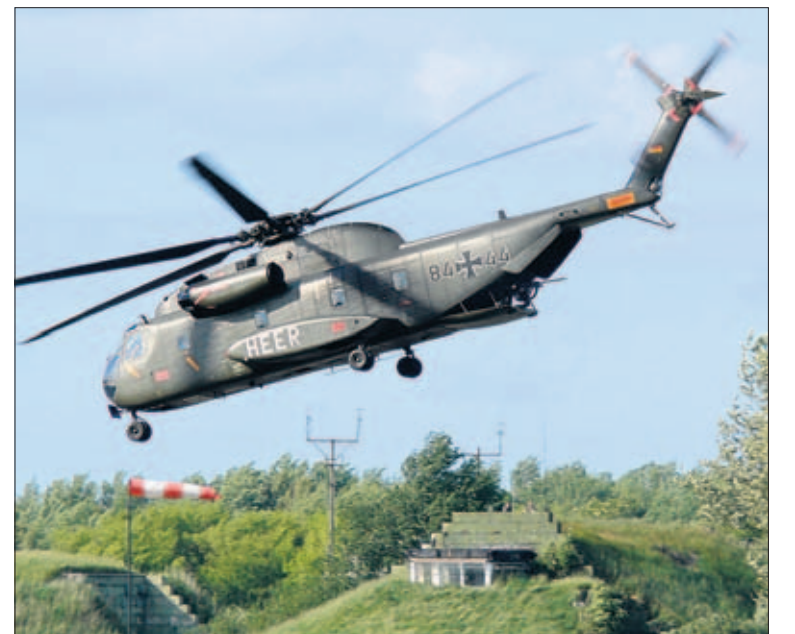
Beim Taktik-Training mit dem Helikopter nutzten die Einsatzkräfte die alten Towergebäude auf dem Peenemünder Flugplatz.

Dass Privatflieger dennoch auch weiterhin den Flugplatz ansteuern können, klappt mit Hilfe von Notam (Notice to Airmen). Mit diesem System kann sich der Pilot im Rahmen seiner Flugvorbereitung auf alle Informationen – so auch zur laufenden Übung – stützen, die seinen Start- und Zielflugplatz sowie seine Flugstrecke betreffen. Da es laut Lamla derzeit in der Woche nur 15 bis 20 Kleinflugzeuge sind, könne das problemlos mit den Kräften der Bundeswehr koordiniert werden.