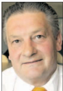
Bernd Schubert, Bürgerbeauftragter von MV.

Wolgast. Elf Personen nahmen gestern die Sprechstunde des Bürgerbeauftragten von MV, Bernd Schubert, in Wolgast in Anspruch. Wie dieser im Anschluss mitteilte, bat jemand in einem Fall in Usedom um Hilfe bei der Genehmigung einer Zufahrt von der B 110 zu einem am Ortsausgang geplanten Imbissstand. Schubert will nun beim Straßenbauamt Stralsund auf eine Entscheidung in der Sache dringen.