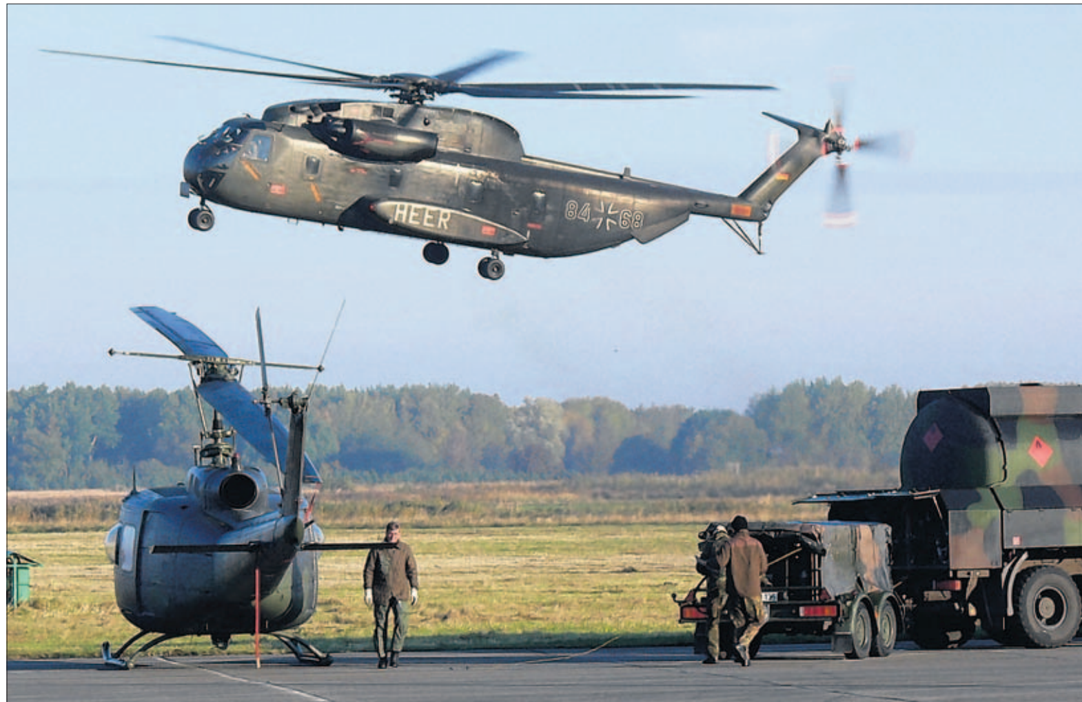
Während der Helikopter vom Typ „Bell“ am Boden in Peenemünde betankt wird, steigt der Pilot mit der Sikorski CH-53 bereits wieder auf.

In einem anderen Fall ging es um die Kürzung des Blindengeldes für einen blinden Mann, dessen Vater anfragte, ob dies berechtigt bzw. ein Ausgleich der Differenz über die Pflegeversicherung zu finanzieren sei. Auch will Schubert Möglichkeiten prüfen, ob für den Betroffenen mittels Eingliederungshilfe ein Job zu bekommen ist. Des Weiteren wurde der Bürgerbeauftragten gebeten, Möglichkeiten einer Tempobegrenzung für den Verkehr auf der Ortsdurchfahrt in Mahlzwang prüfen zu lassen. Vorgeschlagen wurde, Tempo 30 einzuführen, wie dies auch auf den Ortsdurchfahrten in Sauzin, Neeberg und Ziemitz der Fall ist. Schubert will sich bei der Polizei um Tempokontrollen einsetzen und bat die Stadtverwaltung um eine Stellungnahme. T. S.